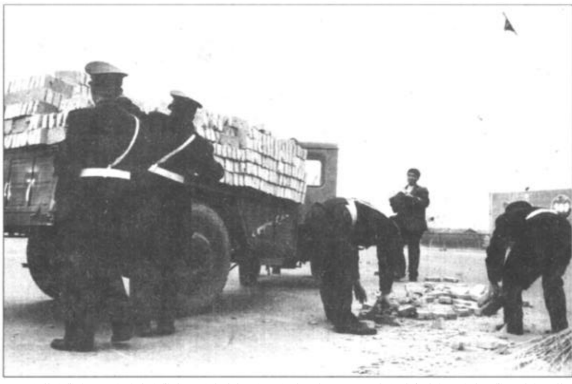
东营交警自开展向济南交警学习活动以来,好人好事不断涌现。图为东城中队海河路岗干警帮助车主装运散落货物。

选准载体 强化教育 “五一”节日期间,为县直机关企事业单位的16对青年举行了集体婚礼,并大张旗鼓地进行了宣传,有力地促进了移风易俗工作的开展。 在党政机关和各行业开展了全岗位、全行业规范化服务活动和优质服务竞赛活动。制定出台了《关于全岗位、全行业规范化服务(工作)活动的实施意见》,召开全县动员大会进行了安排部署。县直各党政机关和各行业主管部门根据实际,制定了切实可行的实施意见,普遍建立了目标责任体系和管理体系。 在总结开展优质服务竞赛活动经验的基础上,又进一步提出了活动要达到“四化”的目标,即活动内容要深化,激励效